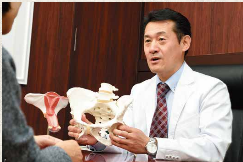
4.リラックスできる空間の中で鍼灸治療を受けられます。施術時間は1回40～50分 5.女性専用の坂戸店はスタッフも女性ばかり。安心して体の悩みを打ち明けられます 6.県内外からの来訪者のほとんどが不妊相談。東洋医学の診断に基に体質をチェック