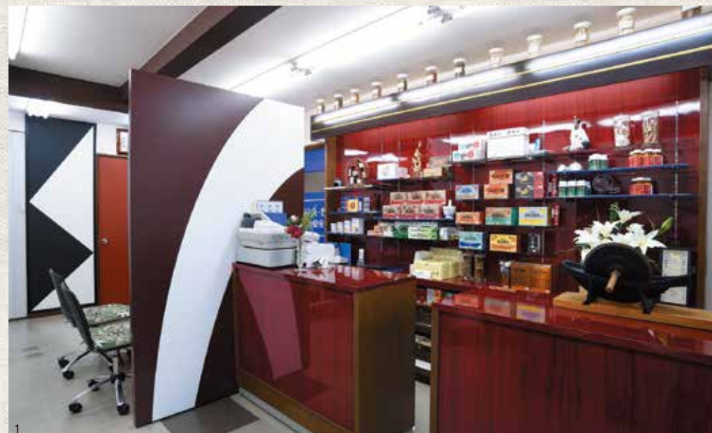
1.落ち着いた雰囲気の漢方薬局の店内。奥には個別相談できるカウンセリングルームが 2.漢方から鍼灸まで幅広く相談のついでにもらえる、寄居本店のスタッフのかたがた 3.寄居本店はベッドが2床。ハリを刺したあとに体をあたためる遠赤外線治療器が完備

た。医療系という仕事柄、ストレスが多く、腰痛や肩こり、冷え、立ちくらみ、生理痛があり、慢性的に炎症の起こりやすい状態でした。そこで2週ごとのカウンセリングを続けながら、漢方薬を服用、週に一度は鍼灸を受けていただいたところ、約1年半で妊娠。体外受精を計画した矢先の自然妊娠でしたから、とても喜ばれましたね。