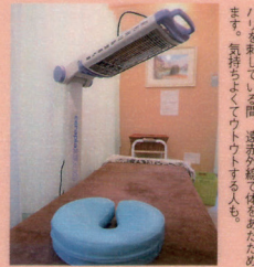
ハリを刺している間、遠赤外線が体にあたためます。気持ちよくウトウトする人も。