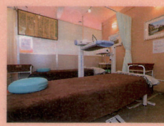
照明のトーンを落とした、リラックスできる空間。オルゴール音に癒されます。