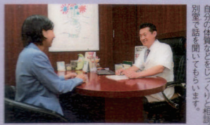
調剤は患者さんごとのオーダーメイド。トウキ、センキュウがよく使われます。

入り口からすぐのカウンター。県内外からの来訪者はばすすべてが不妊相談という。 シンプルで清潔な待ち合いスペース。「授かりました！」ボードに思わず助まされます。